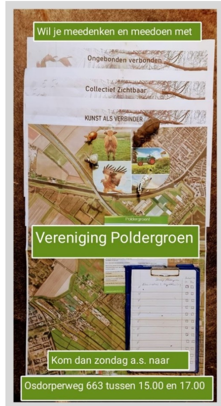
Oproep voor deelname Kavel 663

De verschillen blijken te groot om te overbruggen, waardoor het kernteam in het najaar bezint op een nieuwe strategie. De focus ligt nu op het vinden van een leidend initiatief dat invulling kan geven aan het kavel en hierbij ruimte biedt aan anderen om mee te doen. De initiatiefnemer achter De Kaskantine (hier onder de naam Vereniging Poldergroen) wordt gezien als kanshebber en krijgt enkele maanden de tijd om plannen uit te werken. Gelijktijdig wordt via diverse kanalen gecommuniceerd dat het kavel beschikbaar is. Eind 2021 was nog niet bekend met welke partij definitief verder wordt gewerkt.